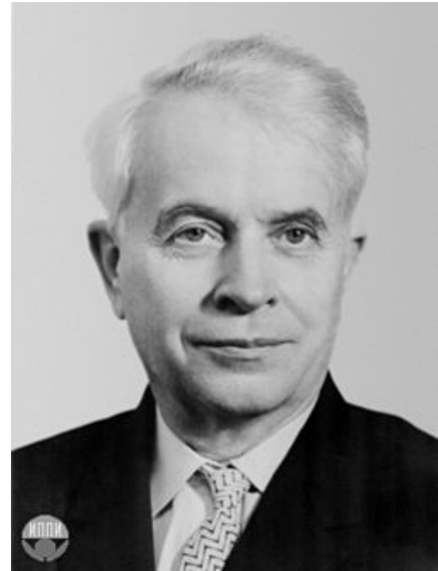
Андрей Марков мл. (9 [22].09.1903 – 11.10.1979)